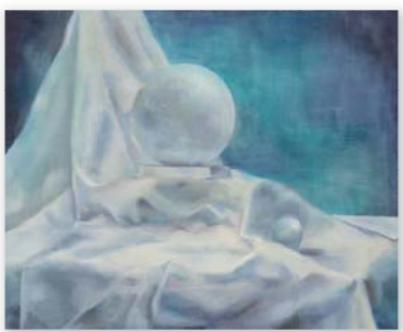
<武蔵野美術大学/油絵学科>合格者作品