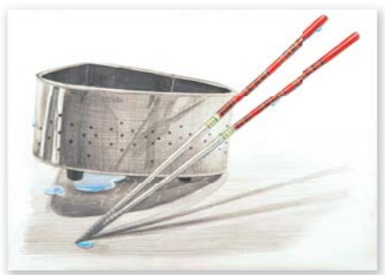
<多摩美術大学/プロダクトデザイン専攻>合格者作品

学生 僕は平日学校の課題が多く出たので、自分に無理のないよう土日受験科にしました。 僕は平日学校の課題が多く出たので、自分に無理のないよう土日受験科にしました。僕の場合は行きたい大学が早めに決まっていたので、土日で一気に集中できたと思います。入試直前になってくると、日曜特訓コースで更なるレベルアップを図りました。そこではこれまで「基礎力」を生かしたと思えます。本番や今でもこの力は、僕を支えてくれる柱です。先生方、今まで本当にありがとうございました。