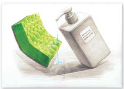
<多摩美術大学/プロダクトデザイン専攻>合格者作品